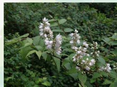
【林道に初夏を呼ぶウツギの花】

この林道は周囲をスギ林やヒノキ林に囲まれています。林の縁にはヤマザクラやイイギリ、カラスザンショウ、コナラ、フサザクラ、エンコウカエデ、ウワミズザクラ等の落葉樹が茂り、陽当たりのよい林道になっています。春の道端には陽当たりを好むバラ科のヤマブキやクサイチゴ、ニガイチゴ、タチツボスミレやナガバノスミレサイシン等のスミレの仲間が目立ちます。初夏からはウツギやガマズミ、サルナシ、タマアアジサイ、オカトラノオウの花が咲き、セミ時雨の中、足下には虫の卵を葉で丸く包んだオトシブミが落ちています。秋にはサラシナショウマやオミナエシの花にツタウルシやイタヤカエデ