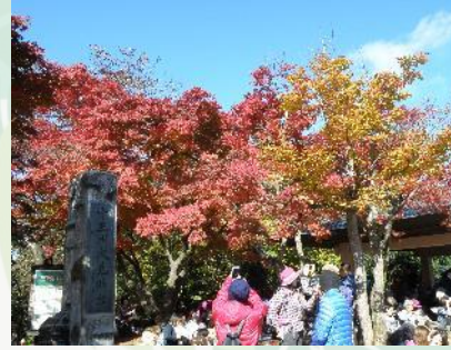
【登山客で賑わう高尾山の山頂】

東京都八王子市にある高尾山(599m)は都心から近く、交通の便が良いことから、家族連れや遠足で来た小中学生で毎日、賑わっています。最近ではミシュランでも紹介され、外国人観光客も多く訪れる山です。