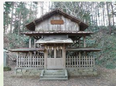
【八王子城址にある八幡神社】

歴史的にも山頂の八王子城主となった北条氏照は高尾山を崇信して寺領を寄進し、竹木材伐採禁止令を出して高尾山の森林の保護に努めたことが知られています。その八王子城へ通じる古道が森の中や周辺の尾根に伸びています。今でも地域の住民は八王子城を造った北条氏を敬い、その関係を大切にしています。北条氏を偲んで毎年春に催される奉納武者行列の祭りは地元住民と北条氏とのつながりの深さを物語っています。城山の北斜面に位置する“ニッセイ高尾の森”は自然の他にも歴史や文化、そしてそこに暮らす人々とも深いつながりがあるのです。