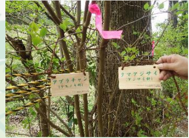
【滝ノ沢林道の植物名プレート】

守りたい森だけを守ろうとしても、その森とつながる周辺の自然を守らなくては効果が期待できません。“ニッセイ高尾の森”を守るには滝ノ沢林道や麓の市街地の自然、そして城山の歴史や文化と人々との関わりのなかで、“城山”を包括的に俯瞰しながら守ることが大切です。