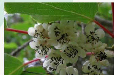
【果実が美味しいサルナシの花】