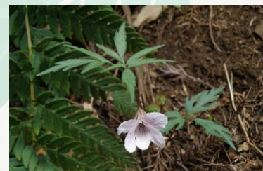
【林床に咲くエイザンスミレ】