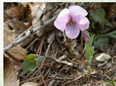
【杉林の縁に咲くアケボノスミレ】

尾根の近くは間伐が済んでいませんが、標高の低い場所ではスギ林の間伐が進み、明るい森の印象を受けます。特に落葉樹の散在する場所では明るい林床（林の中の地面）をつくり、アケボノスミレやアオイスミレ、エイザンスミレ、ナガバノスミレサイシン、マルバスミレ等のスミレの仲間やクワガタソウ、エンレイソウ等の貴重な草本類も観察できます。また、スギ林の縁付近では半日陰を好むコクサギが林床を優先的に被いアブラチャンやタマアジサイ等が目立ちます。草本ではヨゴレネコノメソウやヤマネコノメソウ、ハシリドコロの群落等も観察できます。なお、ツル植物としては、キジョランやツルマサキ、テイカカズラが樹木にからみついています。キジョランはアサギマ