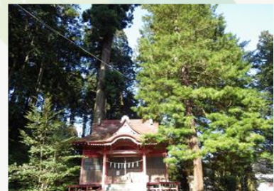
【ムササビの棲む松嶽稲荷神社】

“ニッセイ高尾の森”に至る林道を滝ノ沢林道と呼びます。林道入り口の手前には「松嶽稲荷神社」があります。社の裏の杉林は間伐が進み林床は明るく、貴重な植物のヤマブキソウやラショウモンカズラ等が観察できます。また、スギの大木にはムササビが棲んでいます。ムササビを脅かさないようにスギの幹の巣穴を観察してみましょう。