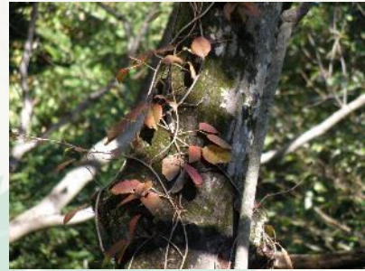
【ツタウルシの紅葉】

の紅葉が山道を飾ります。また、キウイに似たサルナシの実やマタタビ、アケビ、ヤマグリ、オニグルミの実も採集できますが、これらは動物たちの貴重な食糧となります。少し食べて、残りは山の動物たちに分けてあげましょう。この林道にも植物名プレートがあります。植物名を覚えながら滝ノ沢林道の自然を楽しんで下さい。