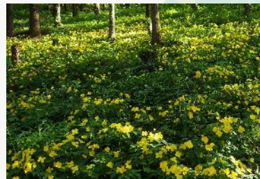
【神社の杉林に咲くヤマブキソウの群落】

滝ノ沢林道には平行して幾つもの古い山道跡が残っています。これらの古道は八王子城址へ北側から通じる道で、林道の西側の尾根の古道には「見張り台」が有ったそうです。“ニッセイ高尾の森”の中にも、森中央を水平に東西に横切る古道があったとされていますから、この地域は甲冑を被った武者達が行き交った場所なのです。