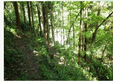
【林床に光が届く“ニッセイ高尾の森”】

“ニッセイ高尾の森”は八王子城址のある城山の北斜面の標高 366m から城山の尾根にかけて広がっています。その広さは 3.36ha になります。この森はスギ、ヒノキの植林地にカツラ、ヤマザクラなどが植林され、ケヤキ、イヌザクラ、カスミザクラ、イイギリ、イロハカエデ、イタヤカエデ、チドリノキ、ミズキ、エノキ、オニグルミ、