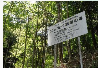
【ニッセイ高尾の森入り口】

“ニッセイ高尾の森”はその城山の北斜面の国有林内にあります。高尾山と同じように暖温帯の植物と冷温帯の植物が混在する地域ですからこの森とその周辺には豊かな自然環境が残されています。現在、森の中、及び、森に至る滝ノ沢林道では多くの樹木や草花を「植物名プレート」で紹介しています。多くの方々から植物観察を通じて、自然を学び、森に親しむ場として“ニッセイ高尾の森”を活用してくださることを願っています。