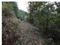
↑入口付近のクスギ (歩道もある)