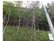
↑送電線の脇のサクラ