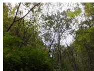
↑ケヤキと沢周辺の 植生