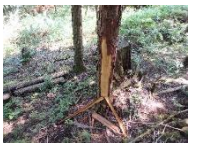
↑シカの食痕 新しい ものが多い