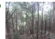
↑イチイガシの状況