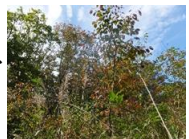
↑ヤマザクラの状況