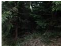
↑奥のヒノキ(枝が混み 合い暗くなっている)