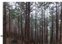
↑ヒノキの状況 (11月のボランティアエリア)