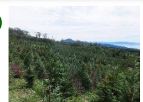
↑富士の森 ③④⑥回地の全景