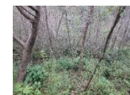
↑斜面に広がる ヤマザクラの状況