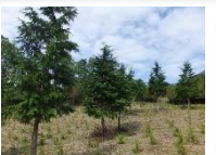
↑富士の森⑧回地 平成28年改植エリア