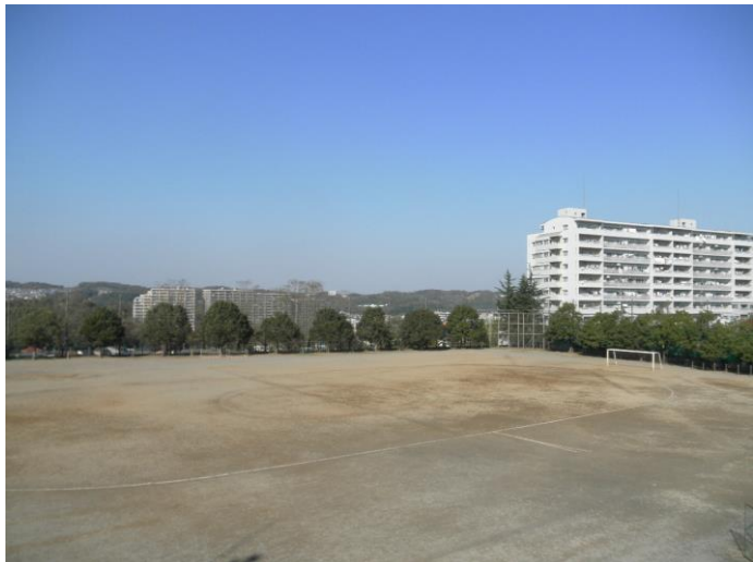
◇校舎から見た 校庭とマンション