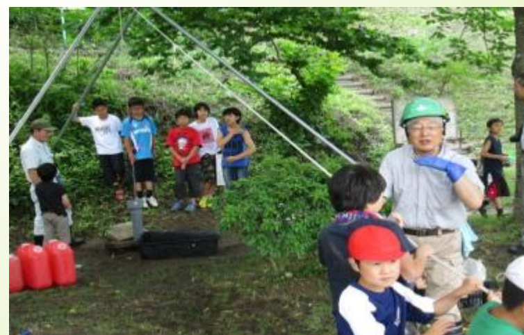
下級生も井戸掘り