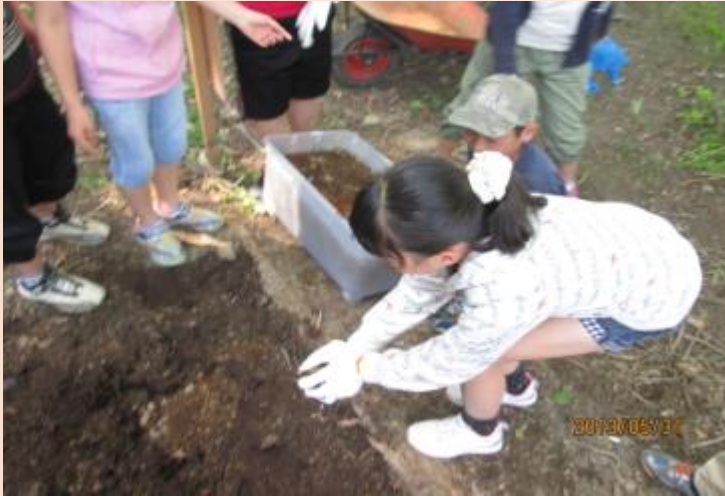
軍手で幼虫を入れる