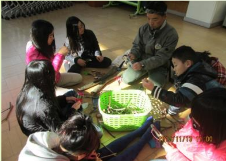
かれ 枝で作る パチンコ