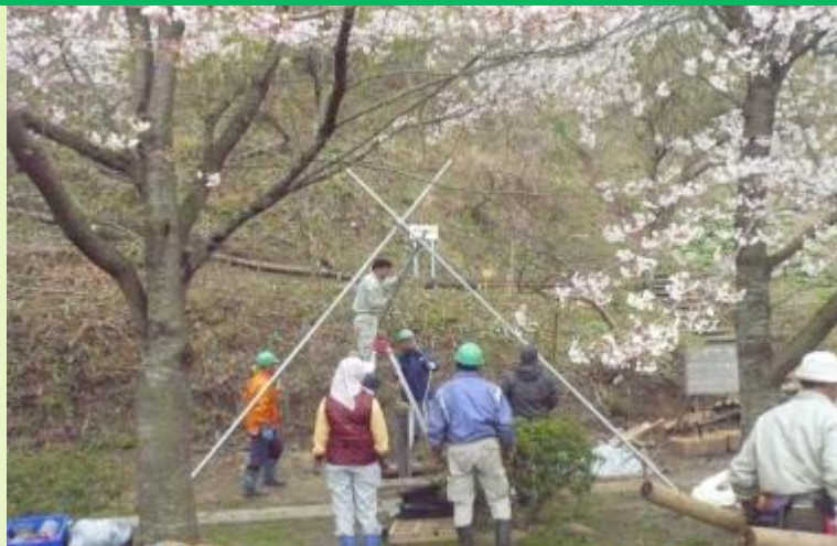
4月から井戸掘り再開