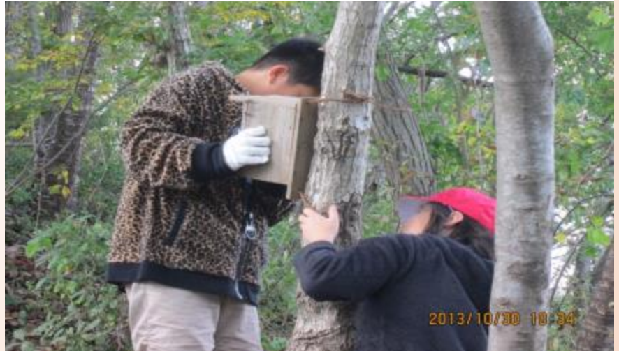
来年もひながかえるといいな