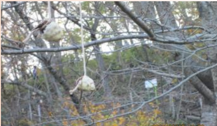
カラスにとられないように 細い枝の先につける