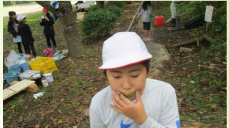
草笛（桜の葉） 花びらでもできるよ