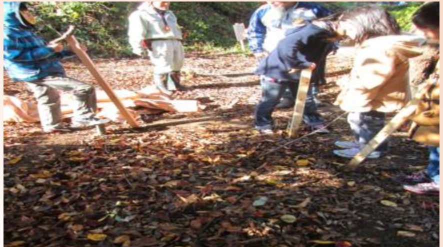
寢床を2倍に広げたよ